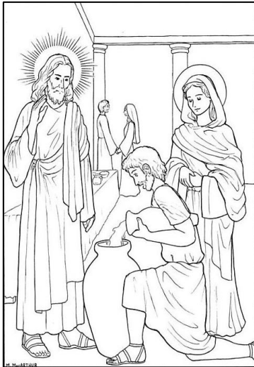
a) Il-Miraklu tat-Tieg ta' Kana